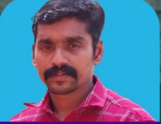
പ്രൊരാജ് എസ്. എസ്.