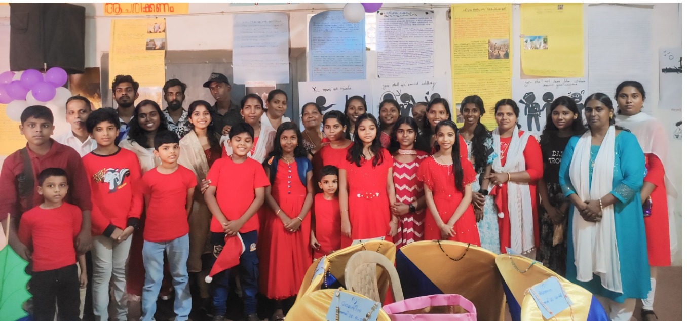
10 കൽപ്പനകളും ഏഴു കുദാശകളും എന്ന വിഷയത്തെ ആസ്പദമാക്കി തിരുപുരം വിശുദ്ധ ഫ്രാൻസിസ് സേവ്യർ ദൈവാലയ മതബോധന യൂണിറ്റ് സംഘടിപ്പിച്ച MYSTERIUM (മിസ്തേരിയം) എക്സിബിഷനിൽ ഒന്നാം സ്ഥാനം കരസ്ഥമാക്കിയ വി. പൗലോസ് ഗ്രൂപ്പ് അംഗങ്ങൾ