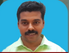
പ്രദീപ് എസ്. എസ്. കുടുംബ പ്രക്ഷിത ശുശ്രൂഷ