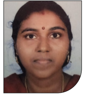
കവിത രഘു പുന്നയ്ക്കാവിള