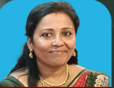
ലിതിറ്റ എസ്.വി. വിദ്യാഭ്യാസ ശുശ്രൂഷ