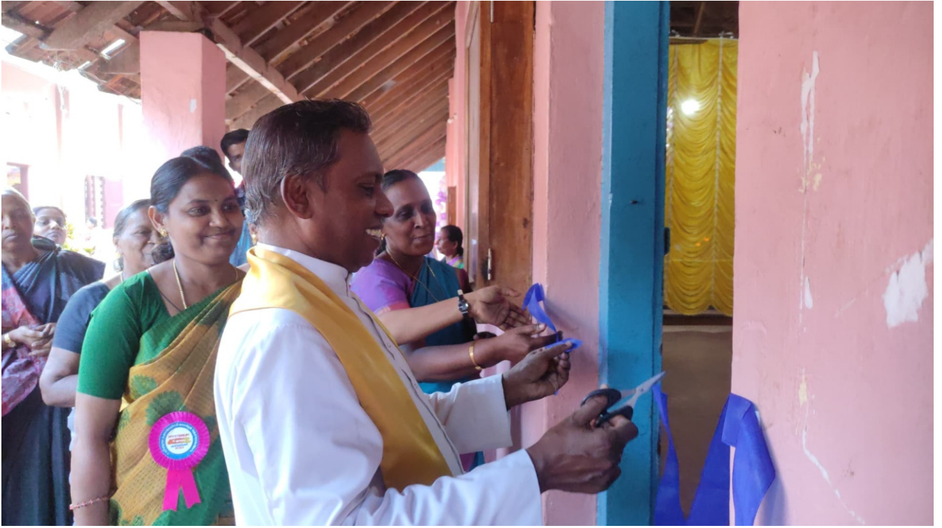
10 കൽപ്പനകളും ഏഴു കുദാശകളും എന്ന വിഷയത്തെ ആസ്പദമാക്കി തിരുപുരം വിശുദ്ധ ഫ്രാൻസിസ് സേവ്യർ ദൈവാലയ മതബോധന യൂണിറ്റ് സംഘടിപ്പിച്ച MYSTERIUM (മിസ്തേരിയം) എക്സിബിഷൻ ഇടവക വികാരി ഉദ്ഘാടനം ചെയ്തപ്പോൾ