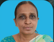
ഷീജ ജെ.എച്ച്. മതബോധന എച്ച്.എം.